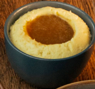
PURÉ DE PAPA JALAPEÑO