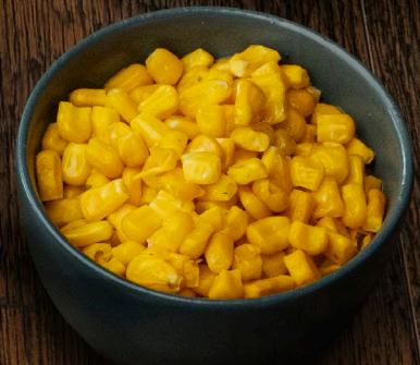
ELOTES A LA MANTEQUILLA