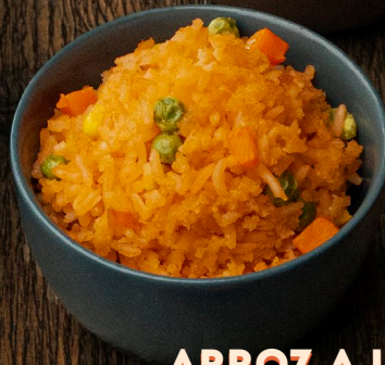
ARROZ A LA MEXICANA