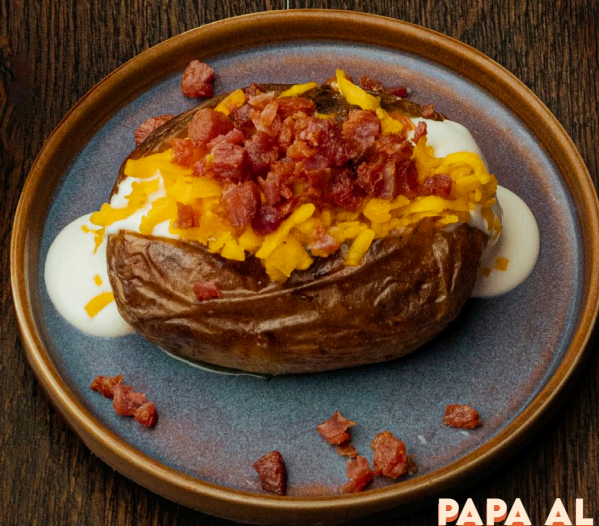
PAPA AL HORNO