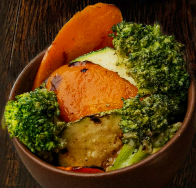
VEGETALES A LA PARRILLA