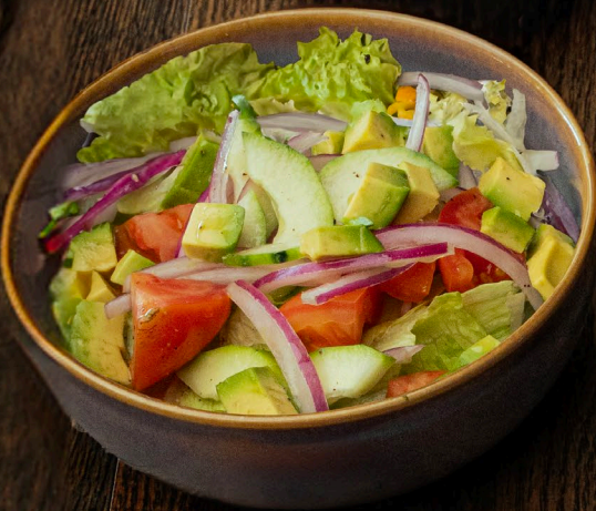
ENSALADA DE LA CASA